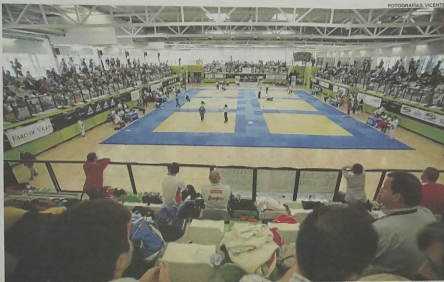
El pabellón de Navia albergó ayer una magnífica jornada de judo, que arrancó a primera hora de la mañana y concluyó con la entrega de trofeos.