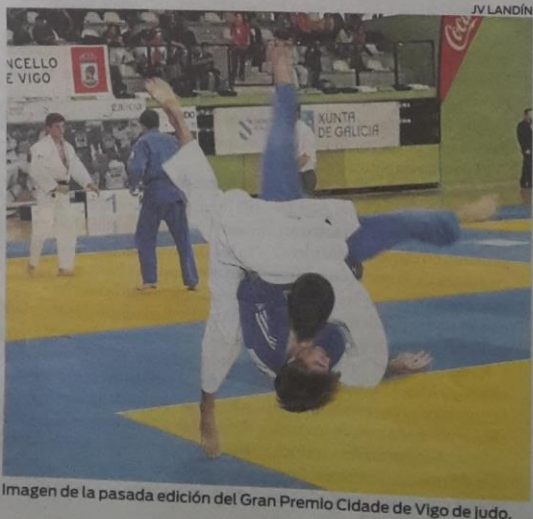
Imagen de la pasada edición del Gran Premio Cidade de Vigo de Judo.

El domingo, los judokas pondrán el broche al fin de semana con un campo de entrenamiento.