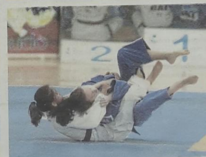
Los casi 400 judokas que se dieron cita en Navia regalaron imágenes espectaculares y momentos de mucha emoción.

Publicado en el Atlántico diario de Vigo el domingo día 11 de octubre.